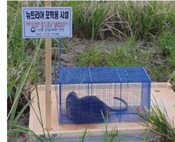
▲ 생물종 다양성 보전사업