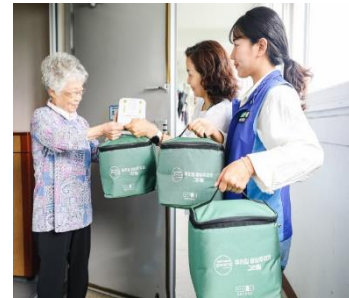
▲ 성남시 독거노인 당뇨식 지원 사업