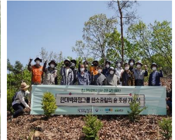
▲ 탄소중립 숲 조성